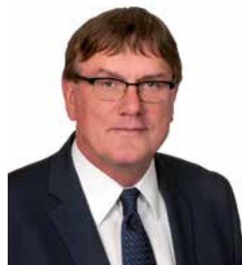
Sebastian Schuster, Landrat des Rhein-Sieg- Kreises

Ich bin sehr optimistisch, dass heute der Grundstein gelegt wird und ein Weg für ein gemeinsames Mobilitätsmanagement und einen Regionalen Mobilitätsplan eingeschlagen wird. Unser gemeinsames Ziel kann nur erreicht werden, wenn die Region zusammenarbeitet.