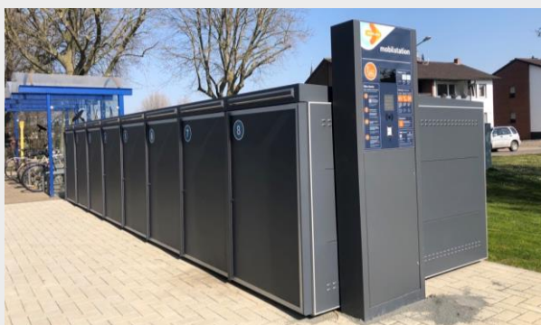
Verschließbare Fahrradabstellanlage in Düren

Über ein Buchungsportal, welches v. a. auch in vorhandene Apps und Webseiten der Verkehrsräume integriert werden wird, können sich Nutzer für jeden Standort NRW-weit über das Fahrradstellplatzangebot informieren und verlässlich einen Platz buchen und bezahlen. Die Kompatibilität mit bereits in NRW existierenden Portalen wie „DeinRadschloss“, „BikeParkBox“, „B+R-Offensive“ oder „Bike and Ride Box“ wird hergestellt.